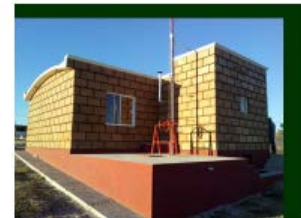
PROYECTO DE AUTOCONSTRUCCIÓN

Tenemos otro proyecto en San Martín de las Pirámides. Es un proyecto con un block que se llama nova block, que es un block térmico. El proyecto lo trajo una persona que hace muchos años también laboró en el fideicomiso y se puso a hacer investigaciones sobre el uso de materiales, y ahorita está implementándose en varios estados.