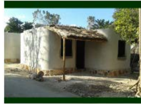
PROYECTO DE CASA MAYA (usos y costumbres)

En el estado de Campeche también se trabaja con ese esquema de usos y costumbres, en el proyecto de la Casa Maya, donde se aplican conceptos muy arraigados de la zona, así como el uso de materiales típicos de la región.